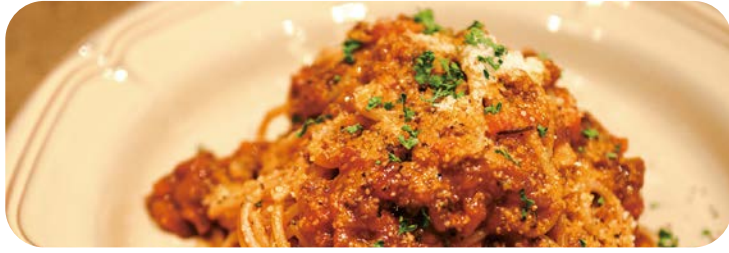
1 シェフこだわりのクラシック・ ボロネーゼ・ミートソース 1,180円 (税込1,298円)