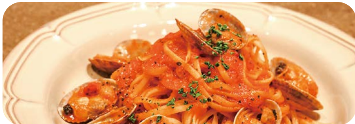
7 たっぴりアサリの トマトソースパスタ 1,580円 (税込1,738円)