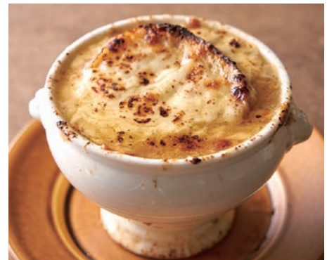
オニオングラタンスープ