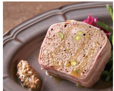
ぶ厚いパテ・ド・カンパーニュ

ガーリックバタートースト 450 (税込 495) Garlic butter toast