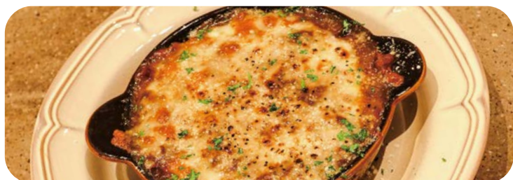
1 オープン仕立ての 濃厚カレードリア 980円 (税込1,078円)