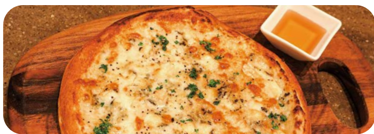
2 ゴルゴンゾーラの クアトロフォルマッジ 1,980円 (税込2,178円)