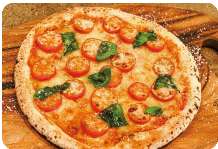
3 完熟甘トマトと フレッシュバジルのマルゲリータ 1,980円 (税込2,178円)