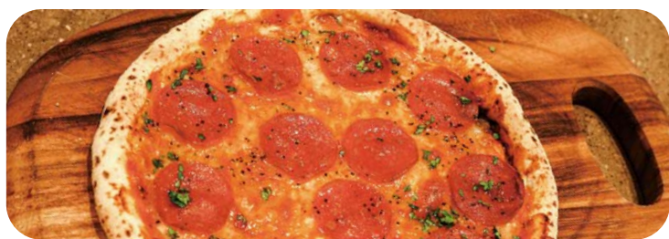
1 ニューヨークスタイル ペパロニピザ 1,580円 (税込1,738円)