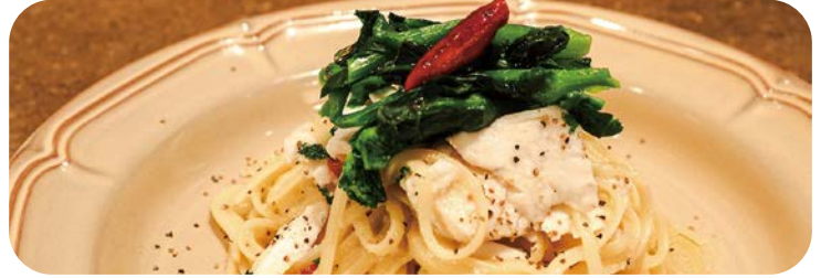
4 真鯛と菜の花のペペロンチーノ 1,480円 (税込1,628円)