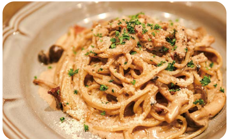
8 濃厚ポルチーニクリーム の贅沢パスタ 1,780円 (税込1,958円)