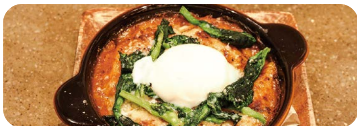
2 菜の花と半熟卵の ミートペンネグラタン 1,180円 (税込1,298円)