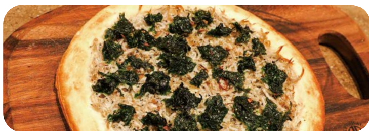
4 磯の香広がる シラスとアオサ海苔のピザ 2,380円 (税込2,618円)