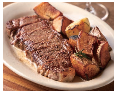
葡萄酒牛ロースステーキ 赤ワインソース or シャリアピンソース

葡萄酒牛ロースステーキ 4,200 (税込 4,620) 赤ワインソース or シャリアピンソース Beef steak with red wine reduction or Chaliapin sauce* *Sweet Japanese-style soy sauce with fresh grated onion