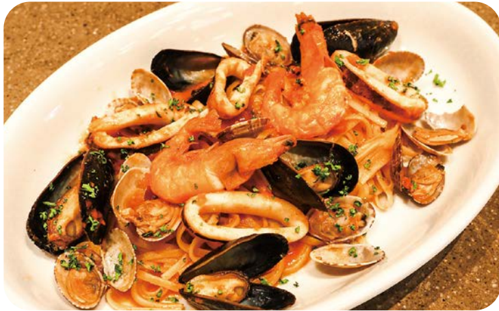
5 魚貝たっぷり 晴海ペスカトーレ 2,380円 (税込2,618円)