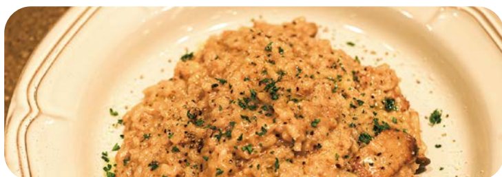
4 濃厚ポルチーニクリーム の贅沢リゾット 1,980円 (税込2,178円)