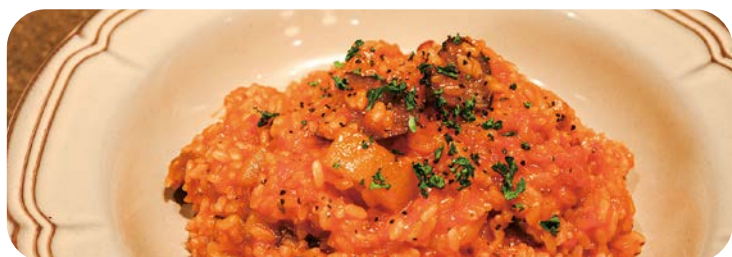
3 農園野菜とトマトの シーフードリゾット 1,580円 (税込1,738円)