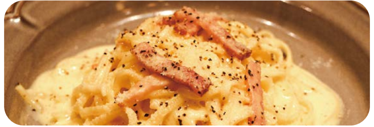
2 濃厚チーズのカルボナーラ 1,280円 (税込1,408円)