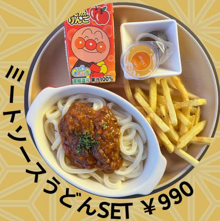
ミートソースうどんSET ¥990