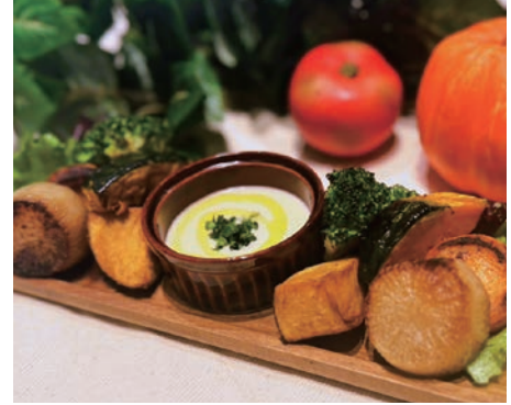
農園の温野菜プレート 濃厚バーニャカウダ仕立て

農園直送フリルレタスとカリカリベーコンの シーザーサラダ 1,380 (税込 1,518) Caesar salad with farm-fresh frilled lettuce and crispy bacon