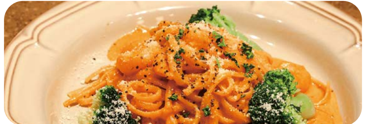
6 海老とブロッコリーの トマトクリームパスタ 1,780円 (税込1,958円)

※ピザ・ドリア・リゾット・パスタ 全ての商品にセットできます ※内容は食材の入荷状況により 変わることがあります