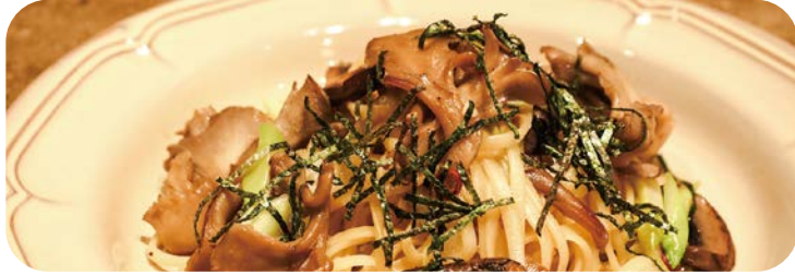
3 3種のキノコとベーコンの 和風パスタ 1,280円 (税込1,408円)